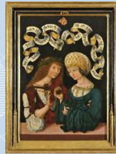
Gothaer Liebespaar, Unbekannter Künstler, Inv. Nr. SG 703 Aus den Sammlungen des Herzogs von Sachsen Coburg und Gotha'schen Stiftung für Kunst und Wissenschaft.

E-Mail: museen@hanau.de · Telefon: 06181-295-1799 Preis: 3,-€ zzgl. Museumseintritt (inkl. Getränk)